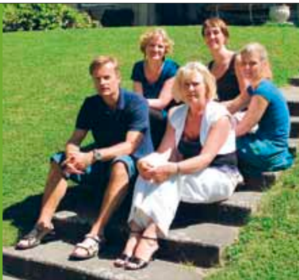
Efteruddannelses-teamet fra KUC.